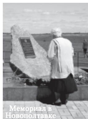
Мемориал в Новополтавке

Еврейские местечки Юга Украины... Это целый пласт истории земледельческих колоний, истории их создания и развития, истории многих трагических событий, связанных с периодом гражданской войны, с периодом Холокоста. Это история многих еврейских семей, потомки которых сегодня живут в разных странах. Многие из них, продолжая жить и работать в Украине, формируют здесь еврейскую общинную жизнь. Немало бывших жителей этих местечек и их потомки живут и в Николаеве. Именно они и стали основными хранителями памяти о жертвах Холокоста, погибших от рук фашистов в годы войны.